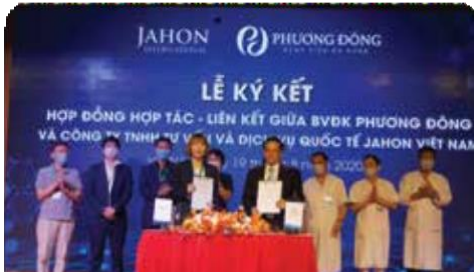
프엉동 종합병원 검진/국제진료센터 계약체결