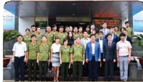
베트남 공안부 병원 사업 협력