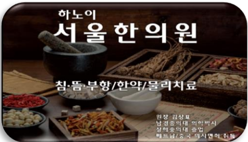
하노이 서울한의원 경영 지원