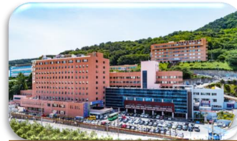
동의료원 베트남 홍보관 운영 지원 컨설팅