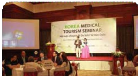
한국의료관광 홍보 설명회