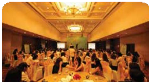
강남의료관광 홍보설명회 기획 및 대행