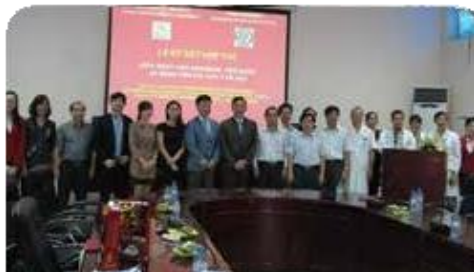
연세대 세브란스 병원-하노이 의과대학 컨설팅