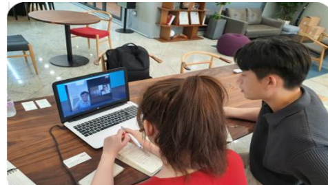
한국글로벌헬스케어 협동조합 화상 수출상담회