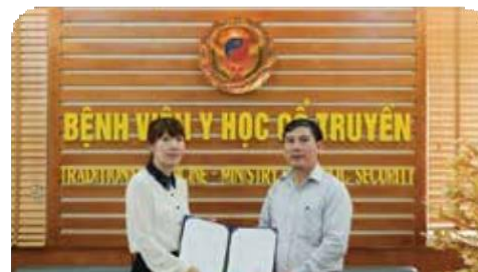
MOU between Jahon International and Traditional Medicine Hospital- Ministry