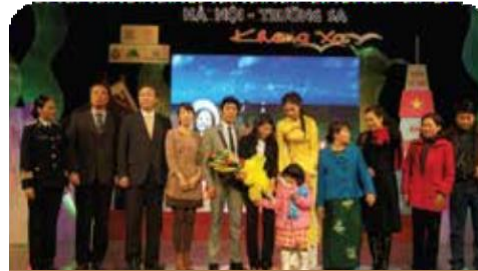
나눔 의료 Love Bridge 생방송