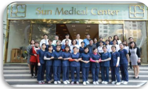
SUN MEDICAL CENTER 경영/행정 지원 컨설팅