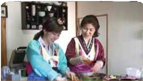
한국 의료관광 홍보 방송 제작/방영