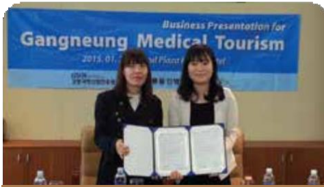
강릉과학 산업 진흥원 협력 협약식