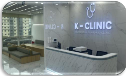
K CLINIK 행정지원 컨설팅