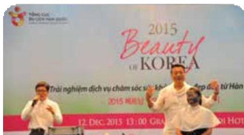
Beauty of Korea 한국의료관광 홍보행사