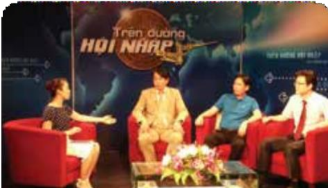
건강 의학 TV 프로그램 제작