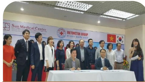
대전 선병원 한국의료시스템 베트남 수출